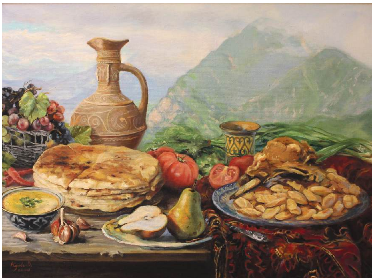
Натюрморт с чӀапилгаш. Холст, масло, 60x80