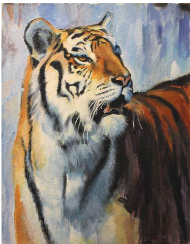
Амурский тигр. Картон, акрил, 40x50