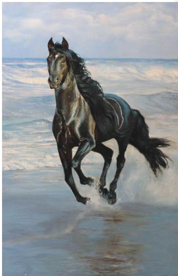
Бегущий по волнам. Холст, масло, 60x90