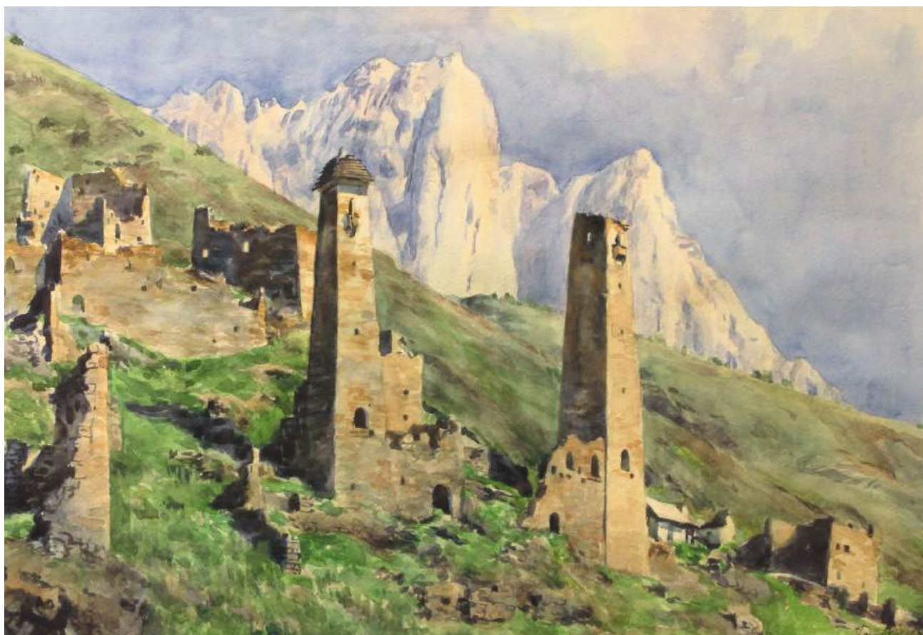
Башни Лялах. Бумага, акварель, 58x40,5