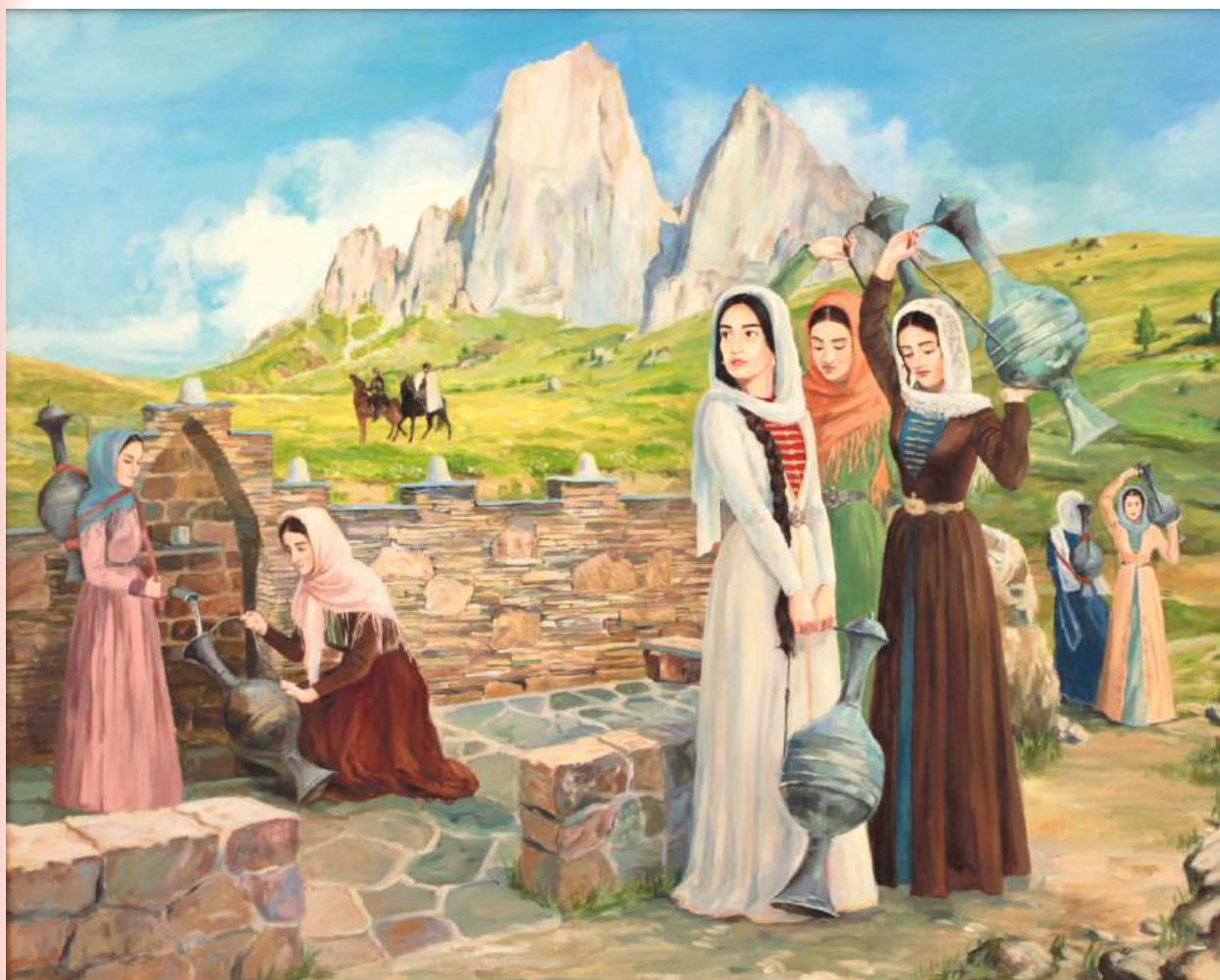
Встреча у родника. Холст, масло, 100x80