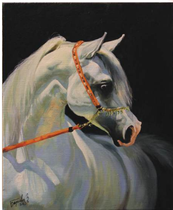
Арабский скакун. Холст, масло, 40x50