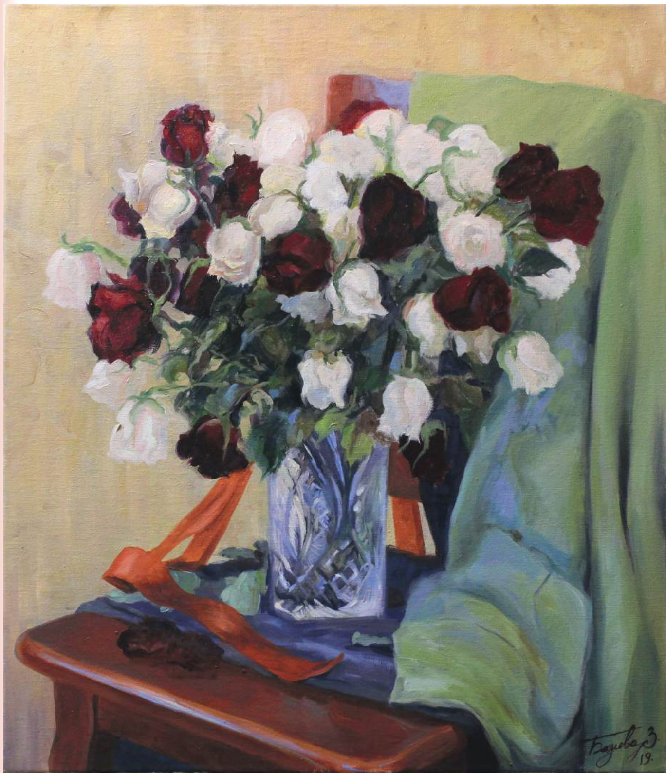
Увядающие цветы. Холст, масло, 60x70