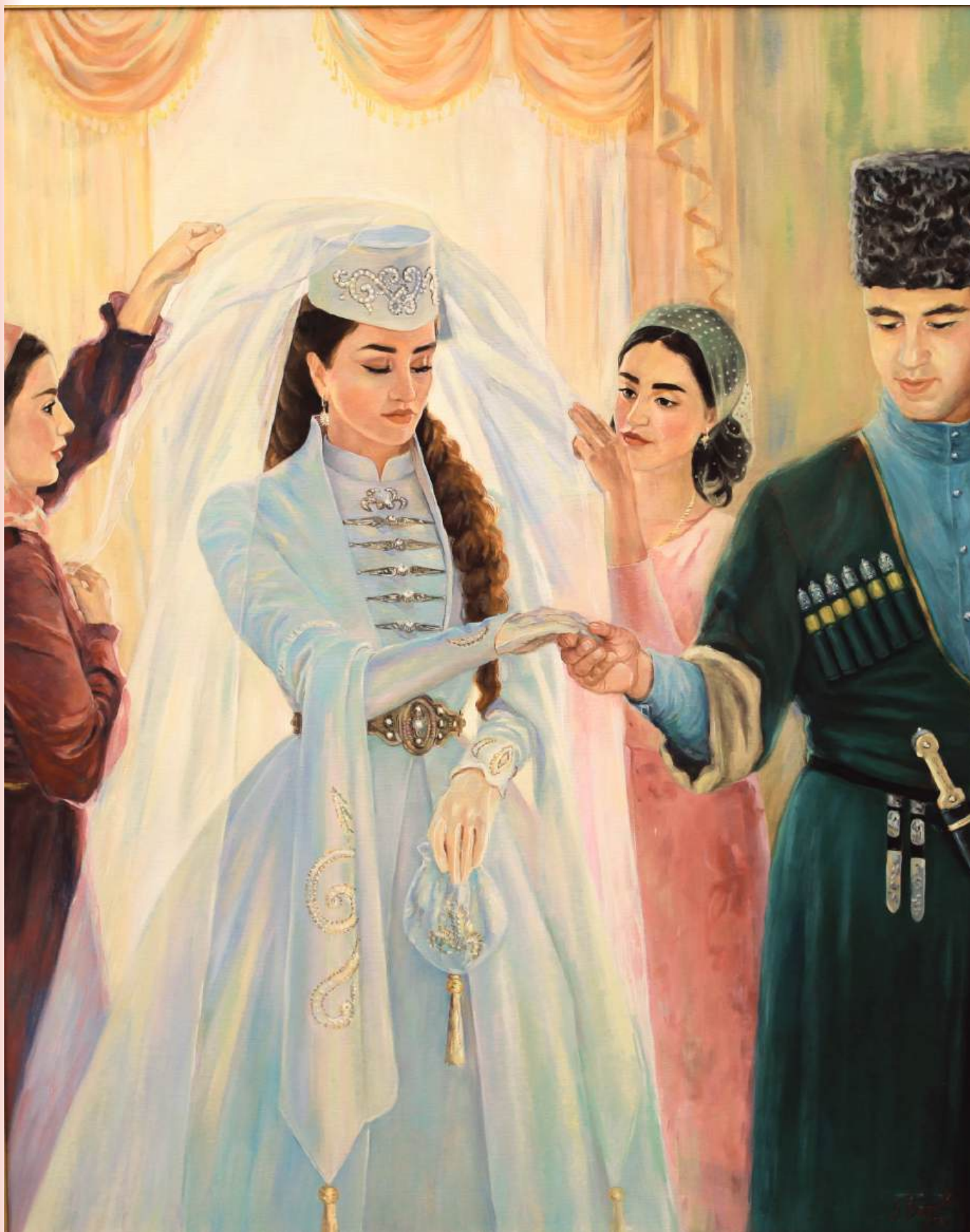
Проводы невесты. Холст, масло, 100x80