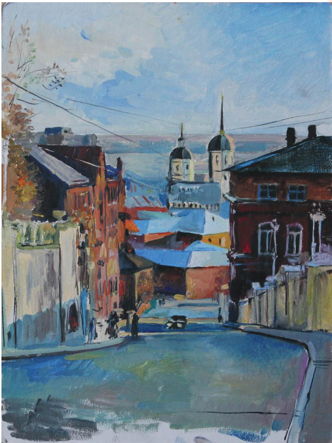
Старый Томск. Картон, масло, 30x40