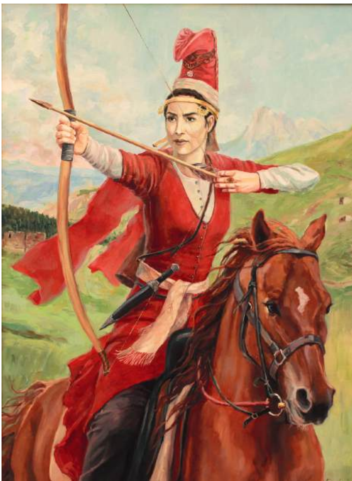
Портрет средневековой ингушки. Холст, масло, 60x80