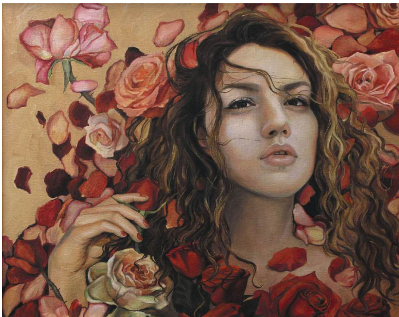
Автопортрет с розами. Холст, масло, 55x46