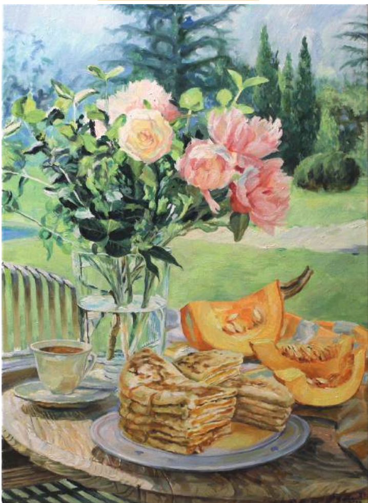
Натюрморт с хингалаш. Холст, масло, 50x70