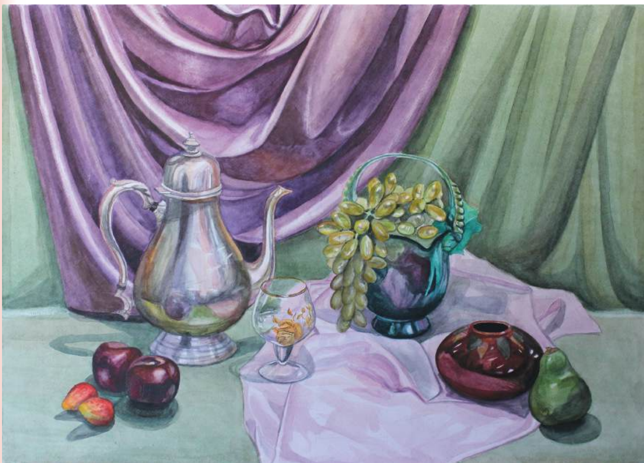
Натюрморт с чайником. Бумага, акварель, 51,5x71