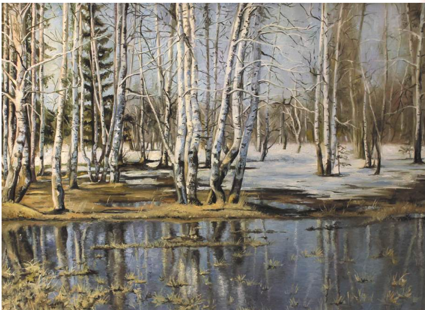
Берёзовая роща. Холст, масло, 55x75