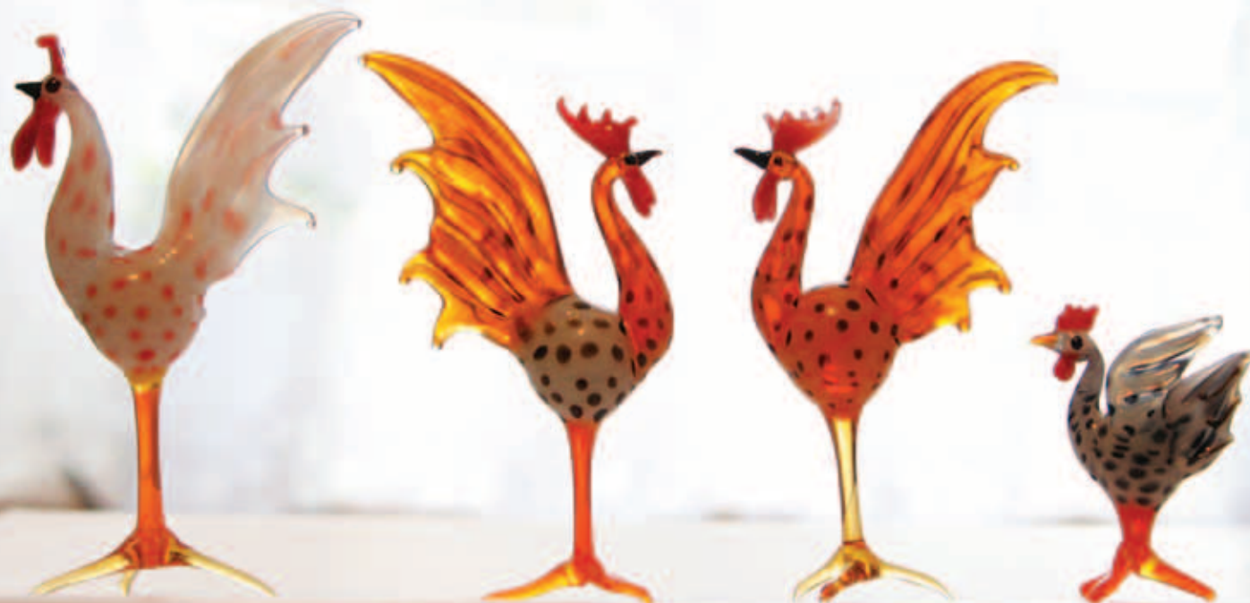
Петушки. Цветное стекло