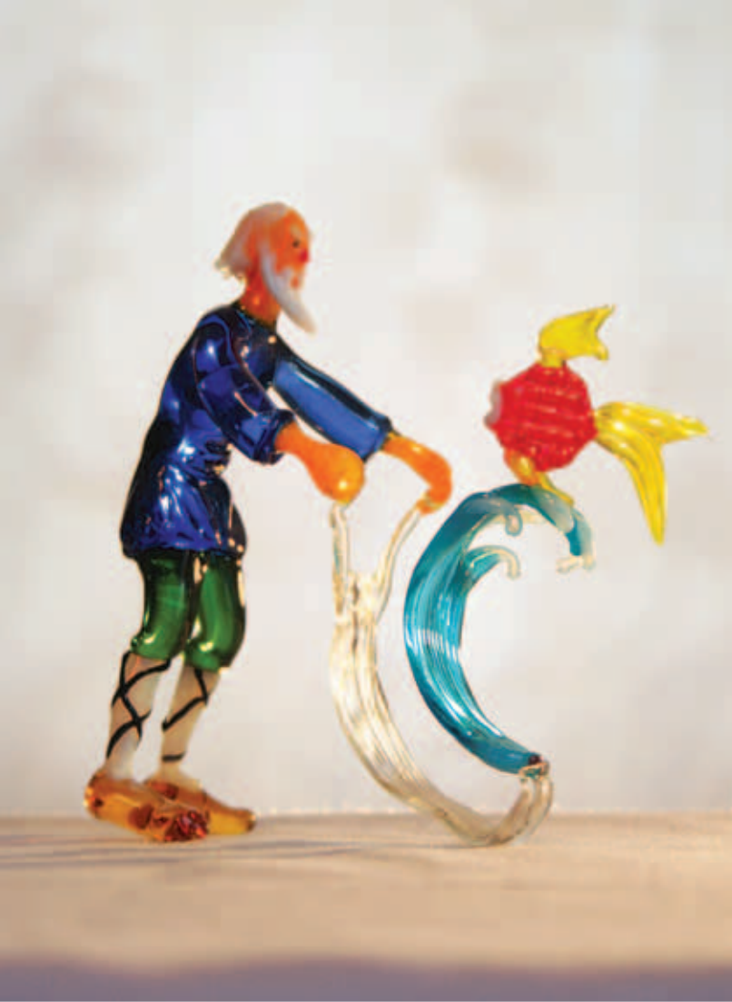
Сказка о Золотой рыбке. Цветное стекло

Миниатюрные скульптуры из стекла и кварца, созданные талантливым мастером, вызывают восхищение зрителем – это гордые джигиты, восседающие на быстрых скакунах, фигурки знаков зодиака, выполненные из цветного стекла, изящные фужеры, фигурки героев ингушского эпоса и русских сказок, строгие причудливые формы канделябров.