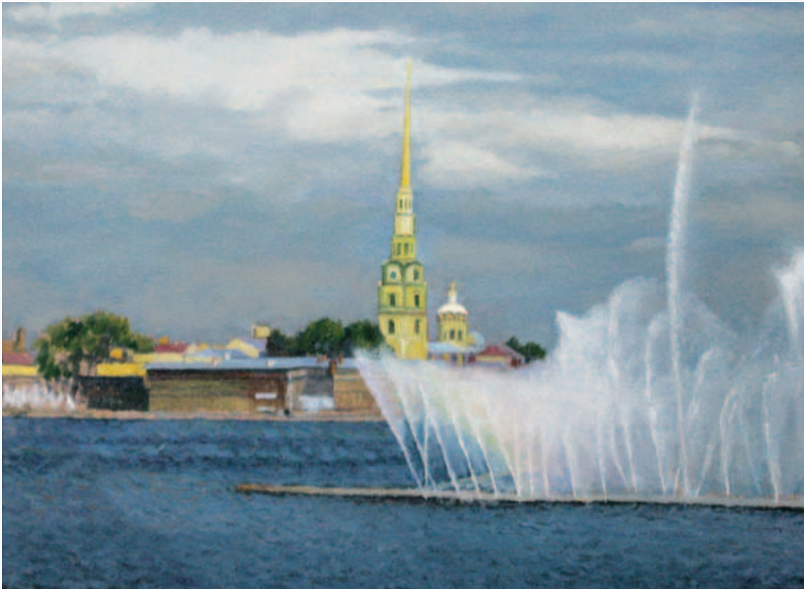
Фонтаны Санкт-Петербурга. Картон, масло, 55х40