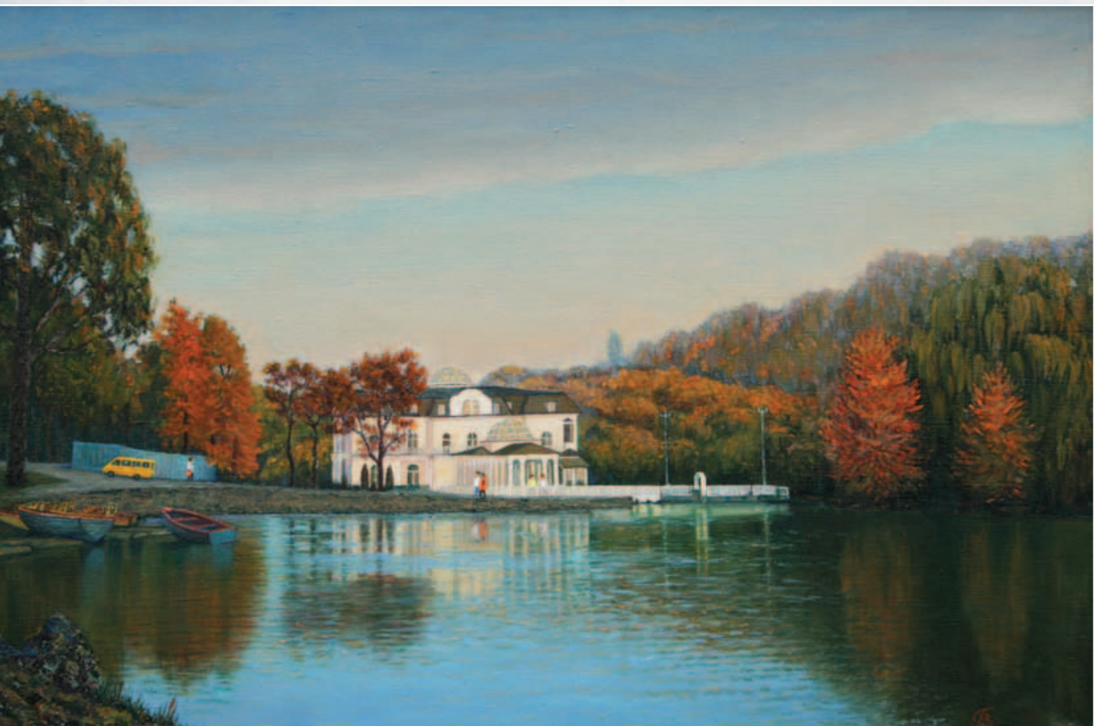
Конец знойного дня. Холст, масло, 60x90