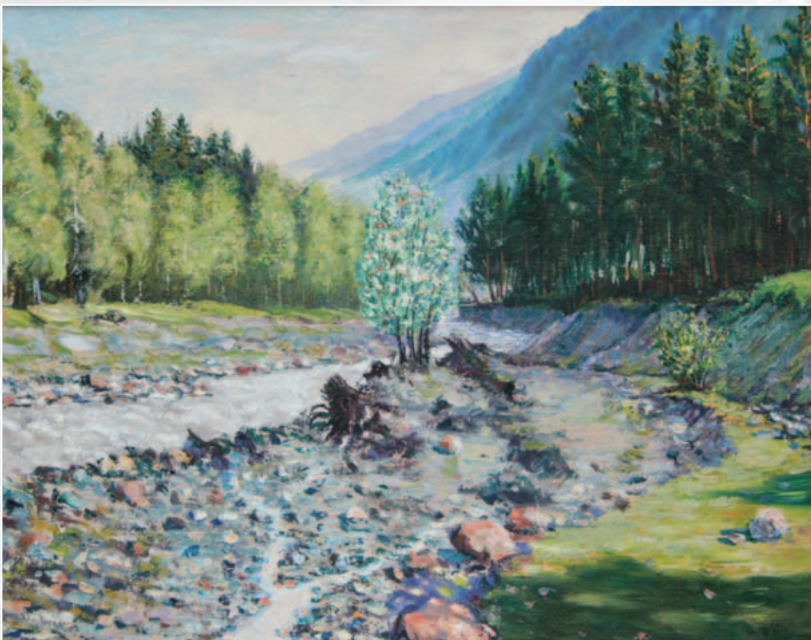
Окрестности с. Тегенекли. Картон, масло, 40x55

С большим мастерством передан внутренний мир созданных персонажей, их мыслей, переживаний. Характерные для мастера поиски большей жизненности, естественности нашли свое воплощение в этих полотнах.