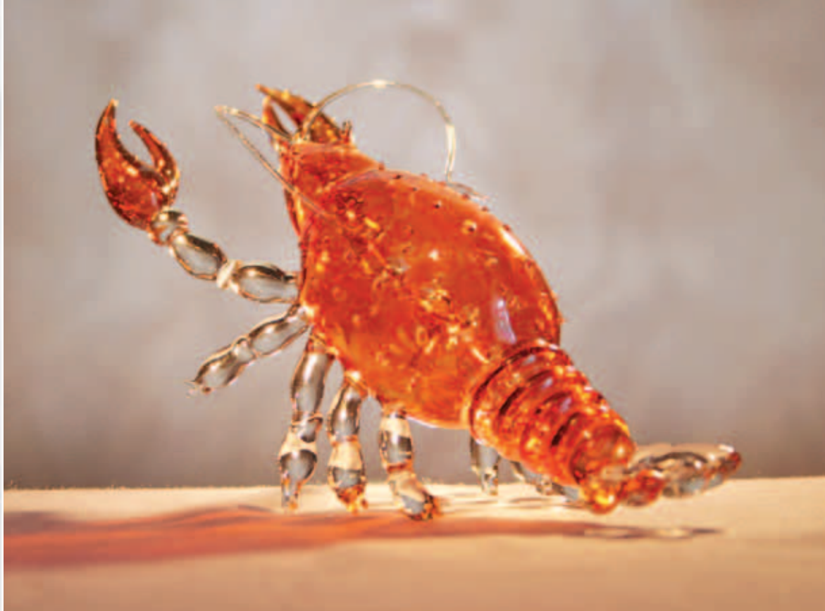
Рак. Знак зодиака. Цветное стекло