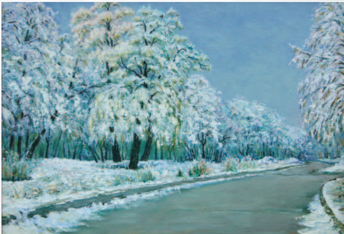
Первый снег. Картон, масло, 40x55