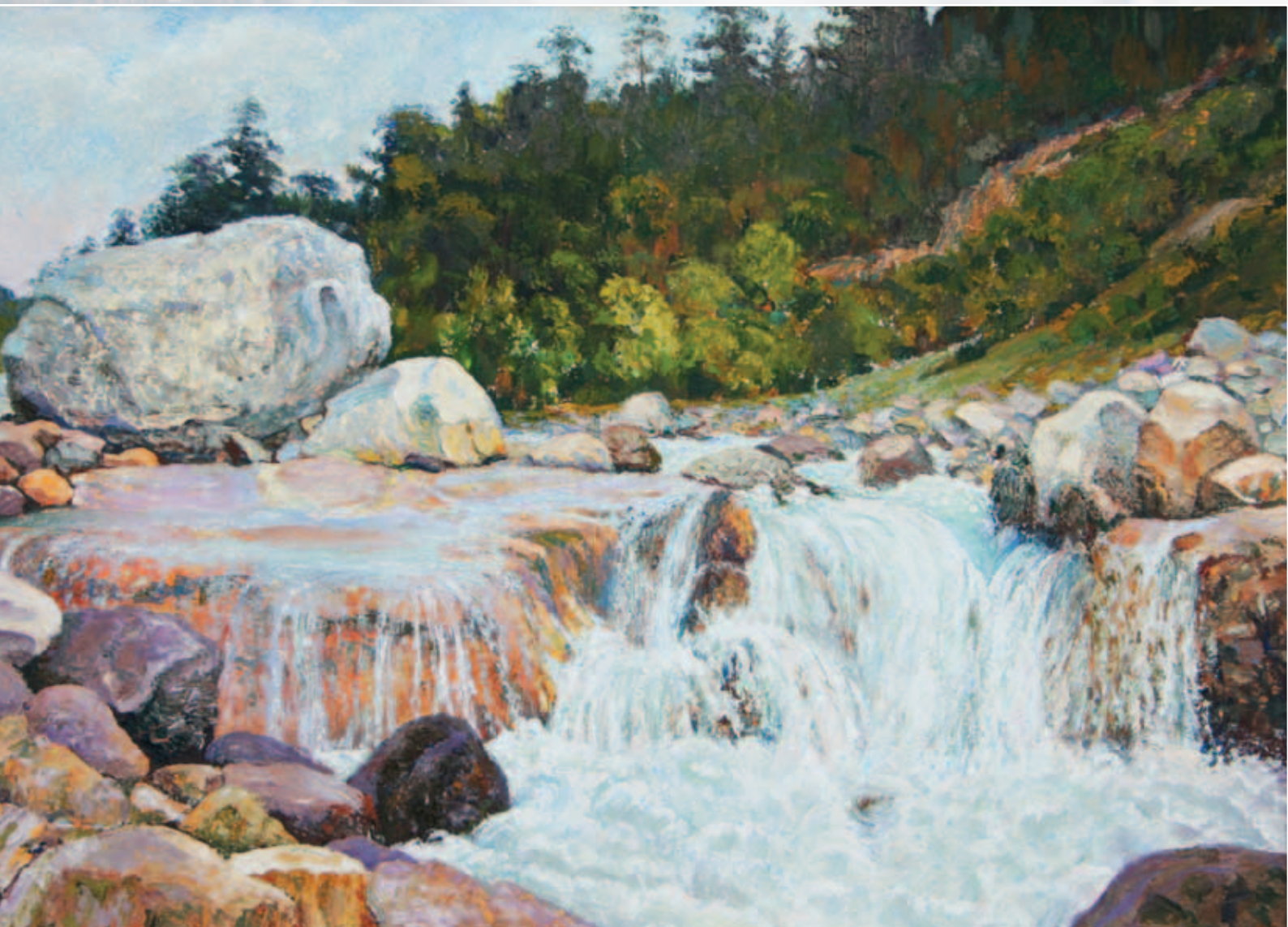
Река Адыр-Су. Картон, масло, 50x70

Впечатления о пребывании художника в горной Ингушетии легли в основу создания таких произведений как «Пережившие века», «Земля предков», «Эрзи». На этих полотнах изображена самобытная природа ингушской земли, суровое величие древних башен. Красота и художественные эффекты, которые характерны для его пейзажей, наиболее ярко выразились в работе «Эгикал». Центральное место в композиционном построении этой картины занимают четко выписанные башни древнего ингушского городища на фоне горы исполинской величины.