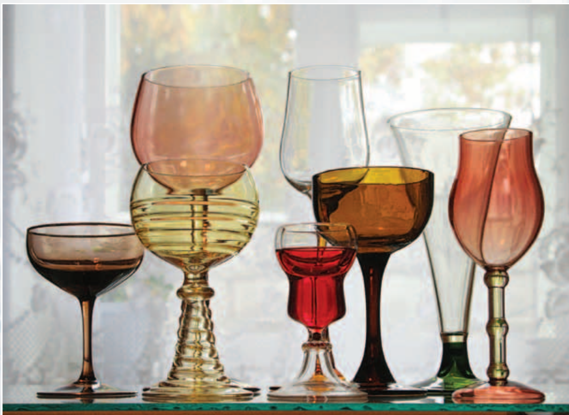
Бокалы. Цветное стекло