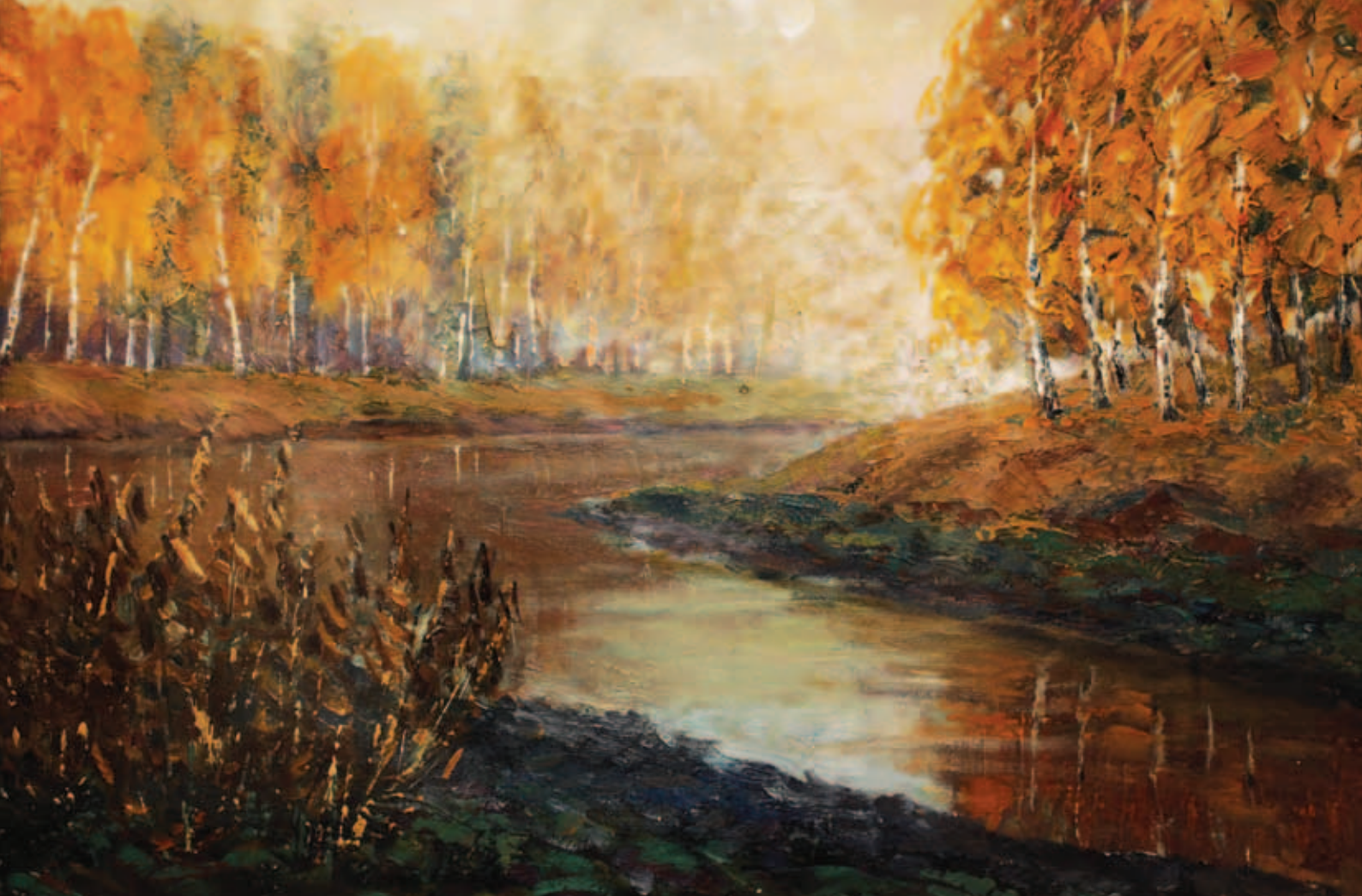
Туман. Картон, масло, 32,5х47