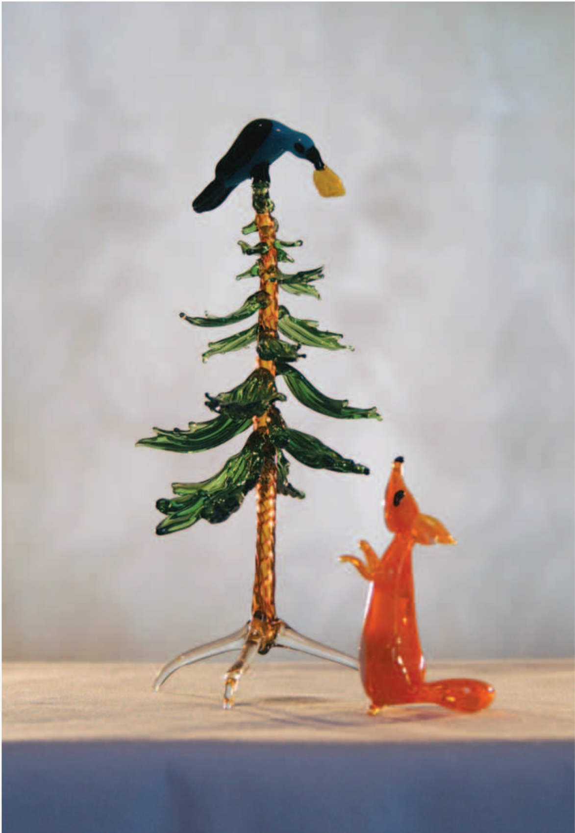
Лиса и ворона. Цветное стекло