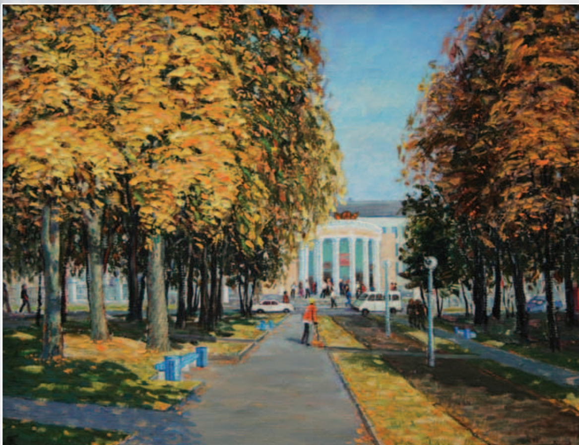
Кабардино-Балкарский государственный университет. Нальчик. Картон, масло, 35x45