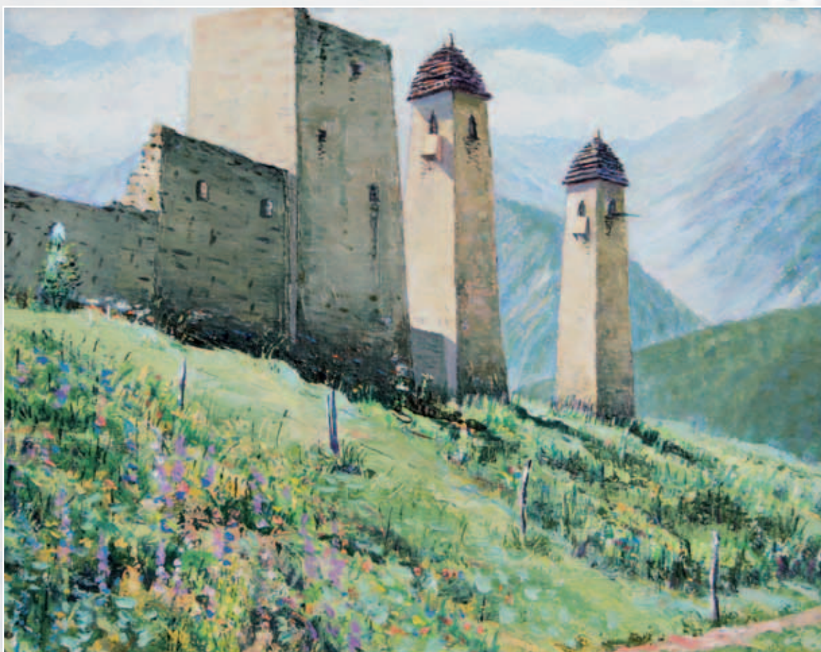
Пережившие века. Холст, масло, 50x60