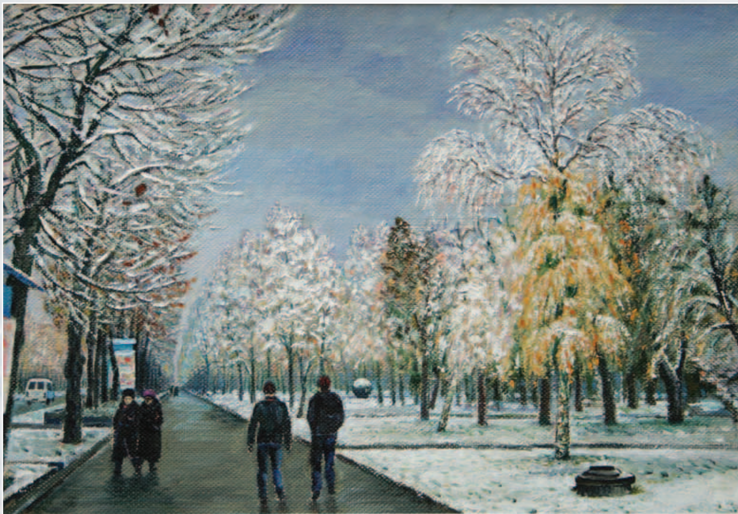
Городской пейзаж. Картон, масло, 55x40

Особое внимание заслуживают работы, на которых запечатлены живописные уголки Кабардино-Балкарии, наполненные задушевностью и поэтическим созерцанием природы Приэльбрусья.