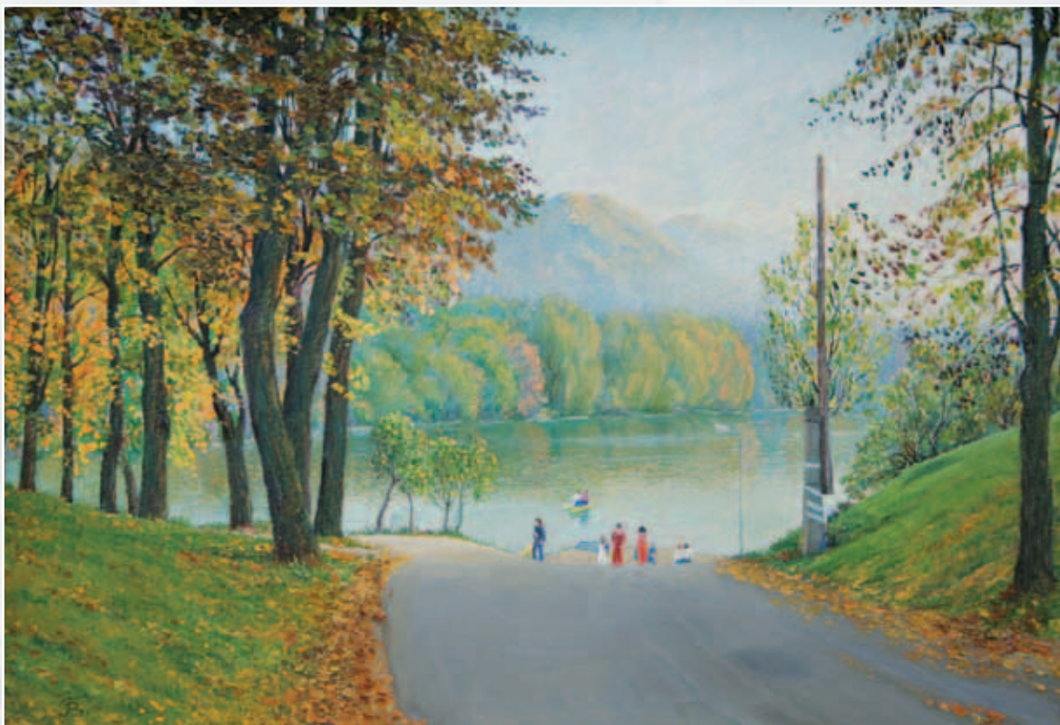
У озера. Картон, масло, 55х40