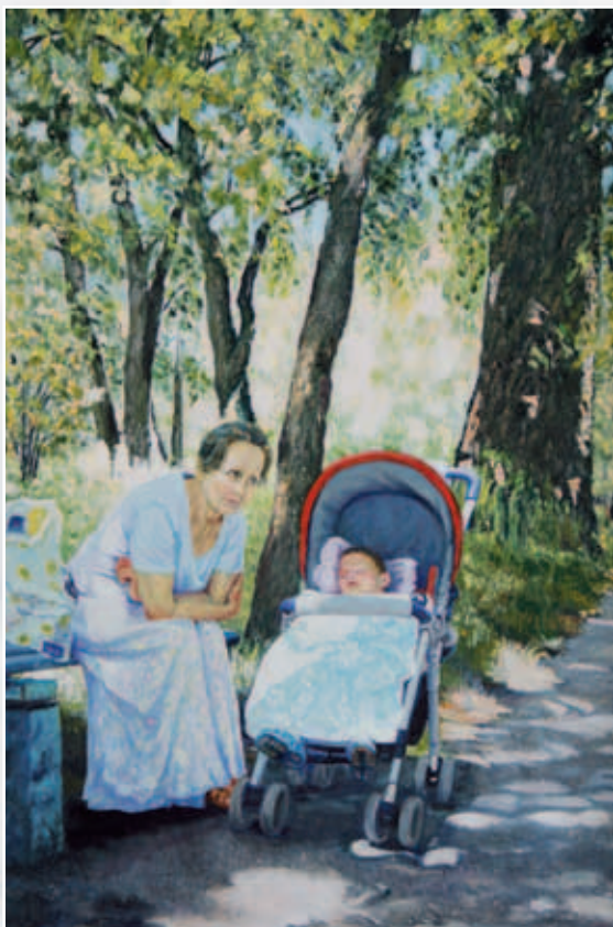
Мечты, мечты... Холст, масло, 50x70