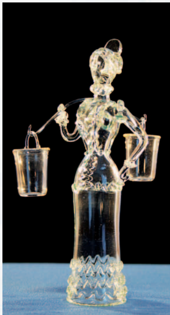
Казачка с ведрами. Стекло, свободное выдувание

По приглашению представителей вновь образованного Новосибирского Академгородка, 10 лет проработал в мастерской института физики полупроводников. Там же молодой мастер начал создавать первые художественные произведения из кварца и стекла.