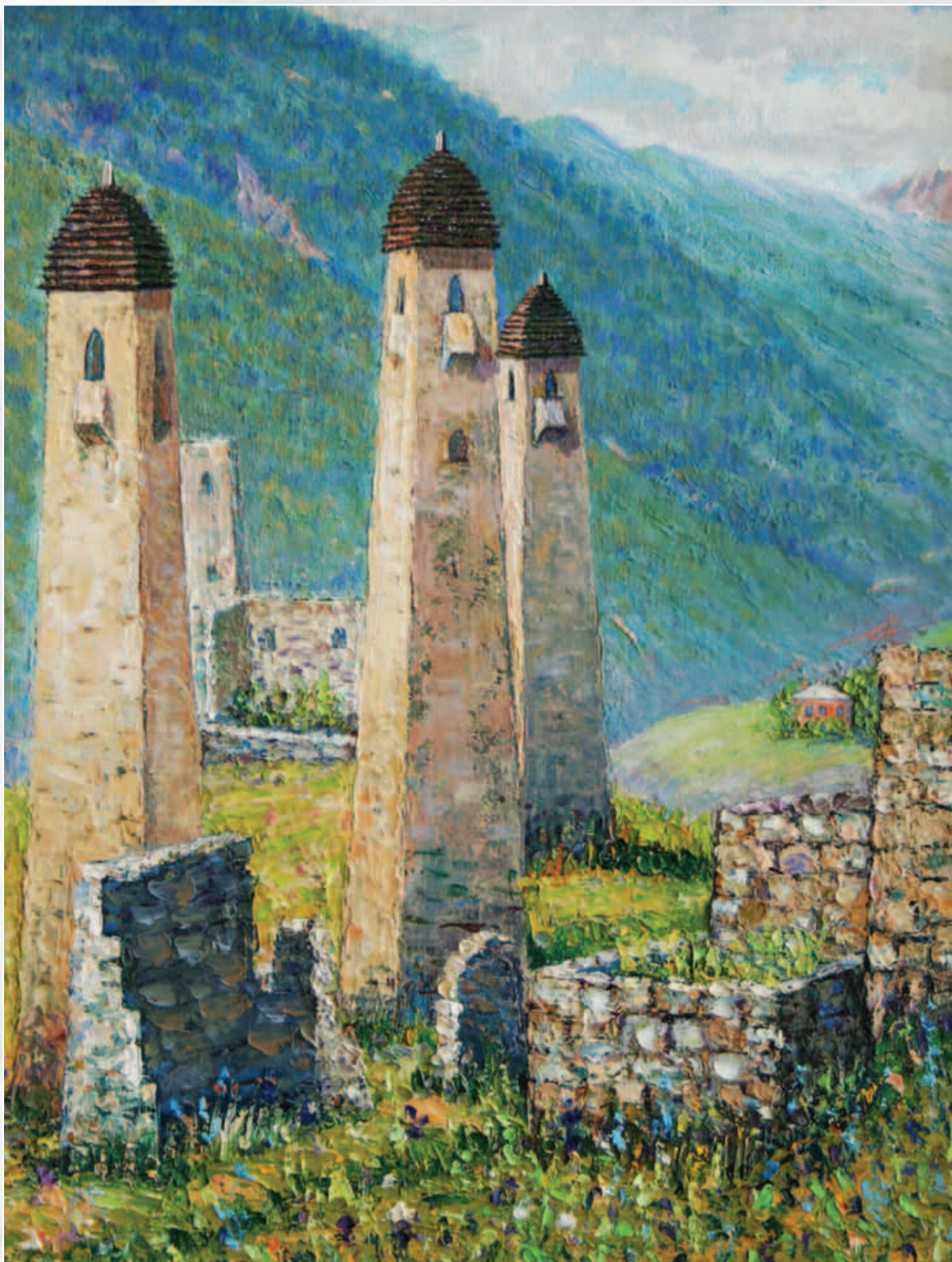
Сторожевые башни. Эрзи. Картон, масло, 40x55