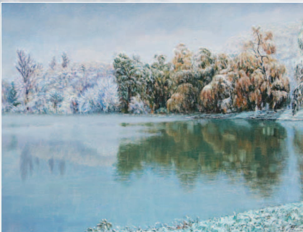
Очей очарованье. Холст, масло, 50x70