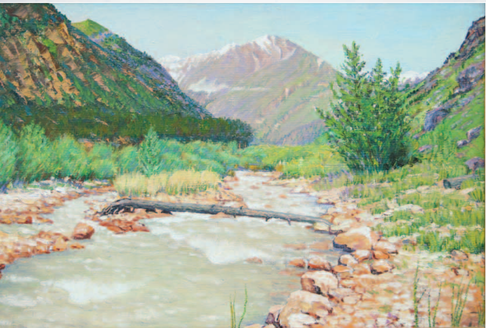
Адыр-Су. Холст, масло, 50x70

Важное место в творчестве Зяудина (Михаила) Батаева занимает живописное искусство, хотя художник больше известен как талантливый стеклодув. Неоднократно в Государственном музее изобразительных искусств Республики Ингушетия проходили персональные выставки мастера, на которых наряду с работами из стекла были представлены и его живописные произведения, выполненные с большим мастерством. Общей чертой всей пейзажной живописи художника является самобытность каждого воплощенного им на картине мотива, в котором переданы особенности природного ландшафта края, изображенного на полотне, своеобразие национальных архитектурных памятников, уклада жизни людей. Небольшие по формату и этюдные по характеру пейзажные картины мастера выполнены на высоком художественном и профессиональном уровне в тонкой и изящной живописной технике.