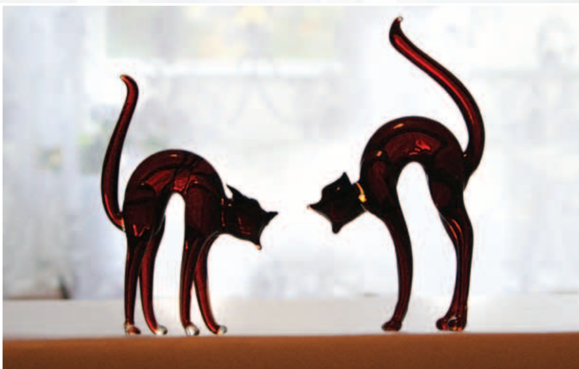
Коты. Цветное стекло