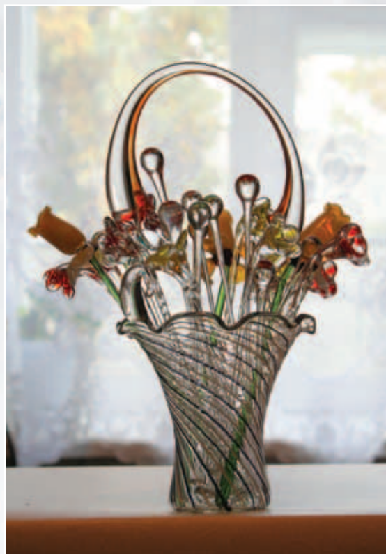
Корзинка с цветами. Цветное стекло