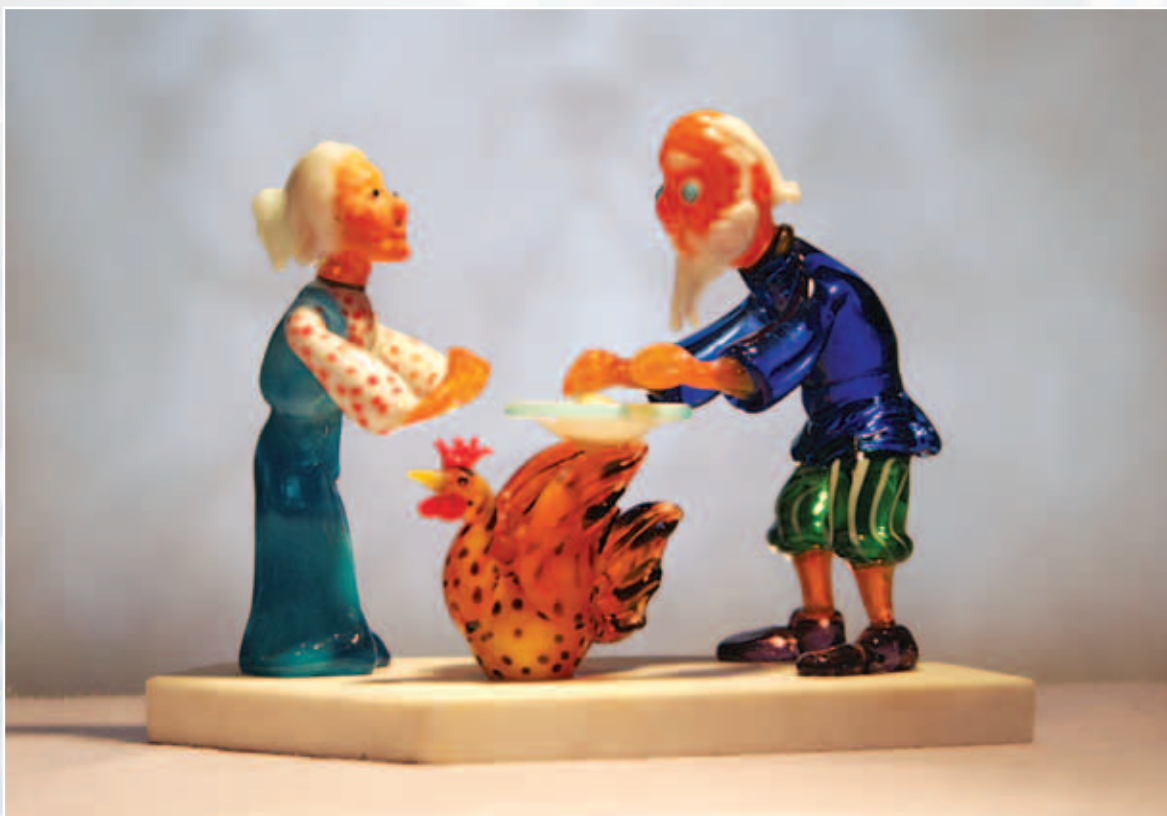
Курочка Ряба. Цветное стекло

Своеобразием и оригинальностью отличаются работы «Петушок», «Ворона и лисица», «Курочка Ряба», словно сошедшие со страниц русских сказок. Эти работы выполнены с большой любовью и полны детской непосредственности, за которой стоит долгий и кропотливый труд.