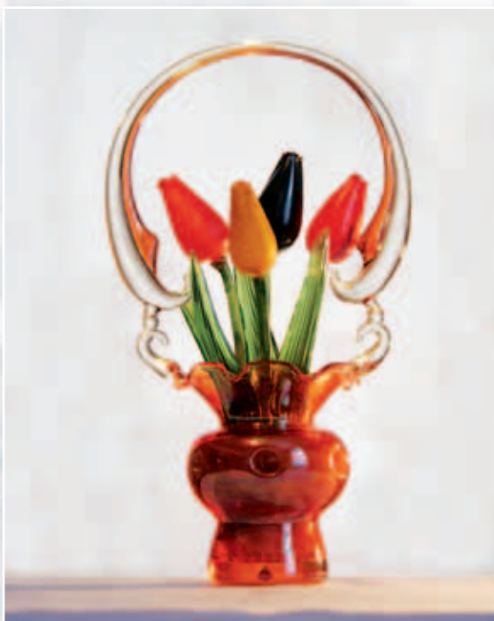
Корзинка с тюльпанами

Работы, выполненные в различные периоды творческой деятельности художника, были по достоинству оценены и экспонировались в Новосибирске, затем на выставке художников-любителей и народных умельцев в Москве, Республике Болгария, а также в различных городах Соединенных Штатов Америки.