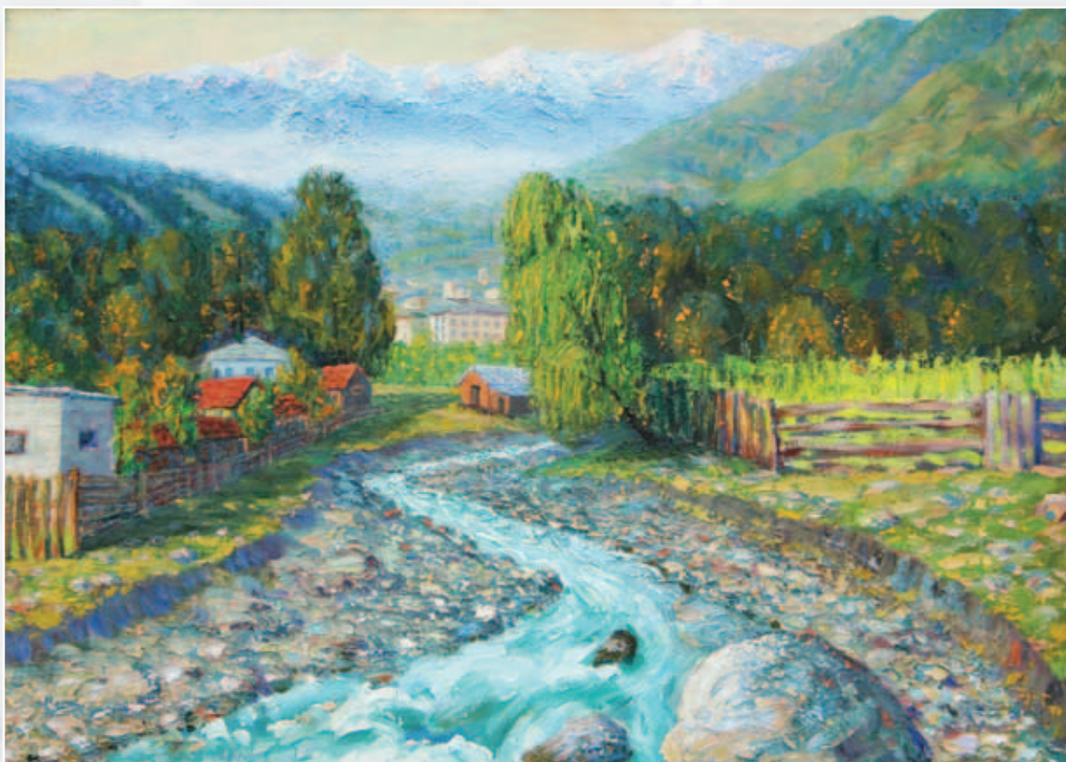
Река Лухуми. Западная Грузия. Картон, масло, 50х40