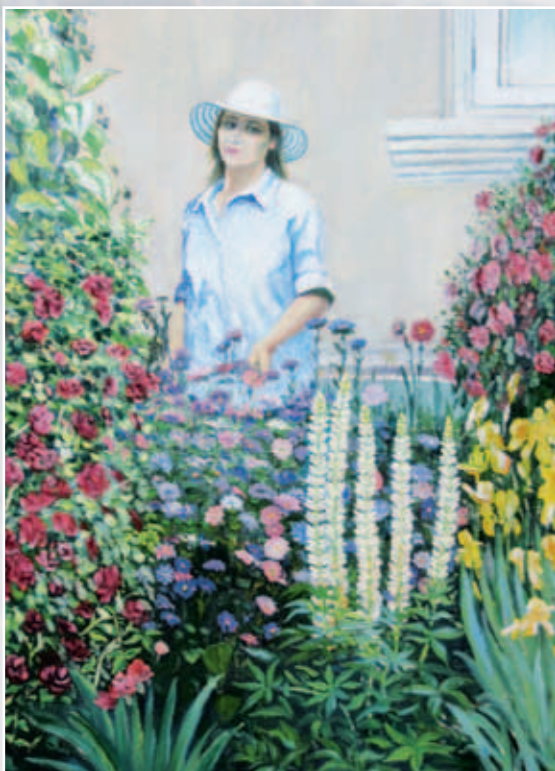
Среди цветов. Картон, масло, 55x40

С большим мастерством передан внутренний мир созданных персонажей, их мыслей, переживаний. Характерные для мастера поиски большей жизненности, естественности нашли свое воплощение в этих полотнах.