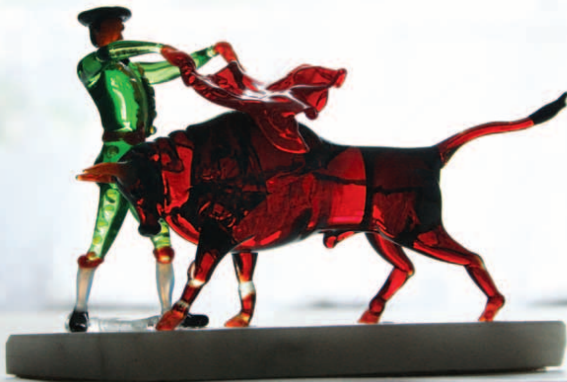
Коррида. Цветное стекло