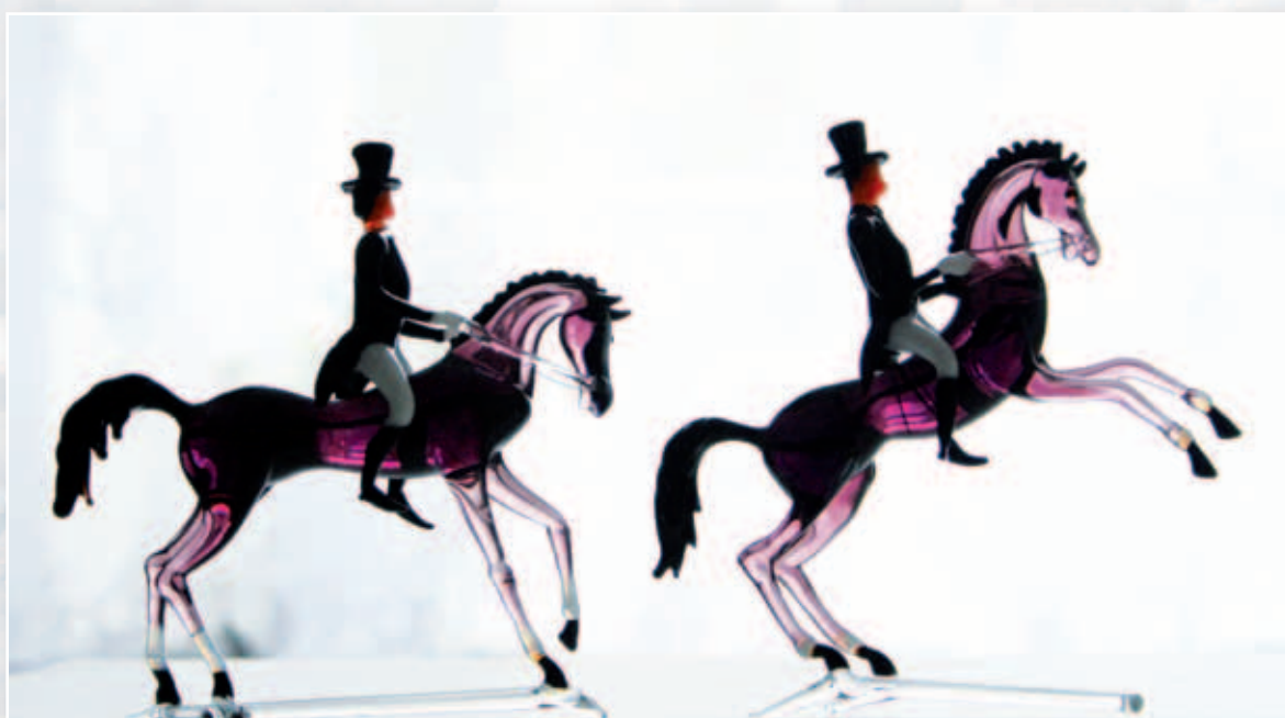
Выездка. Цветное стекло