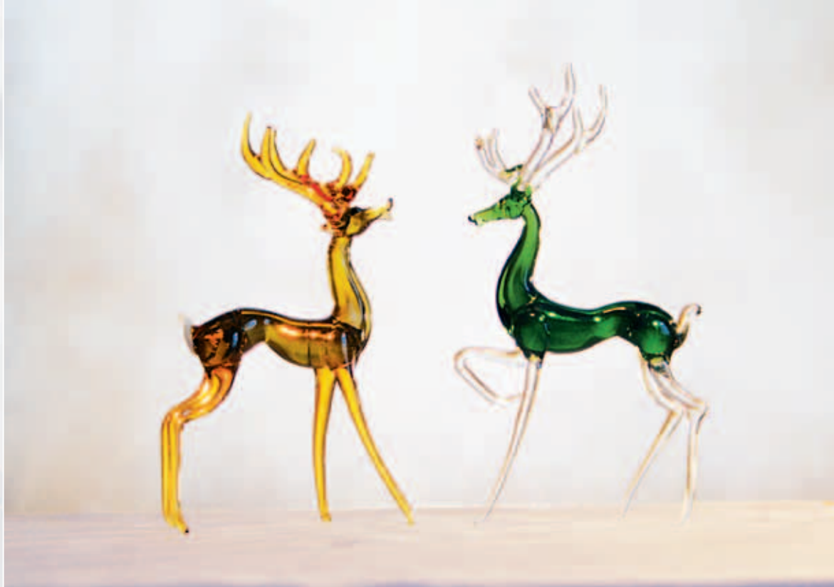
Олени. Цветное стекло