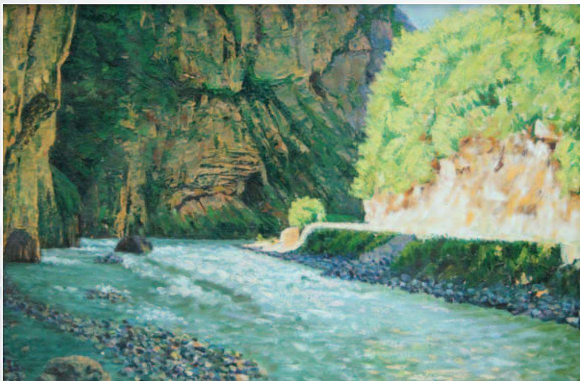
Окрестности Чегемских водопадов. Картон, масло, 35x55