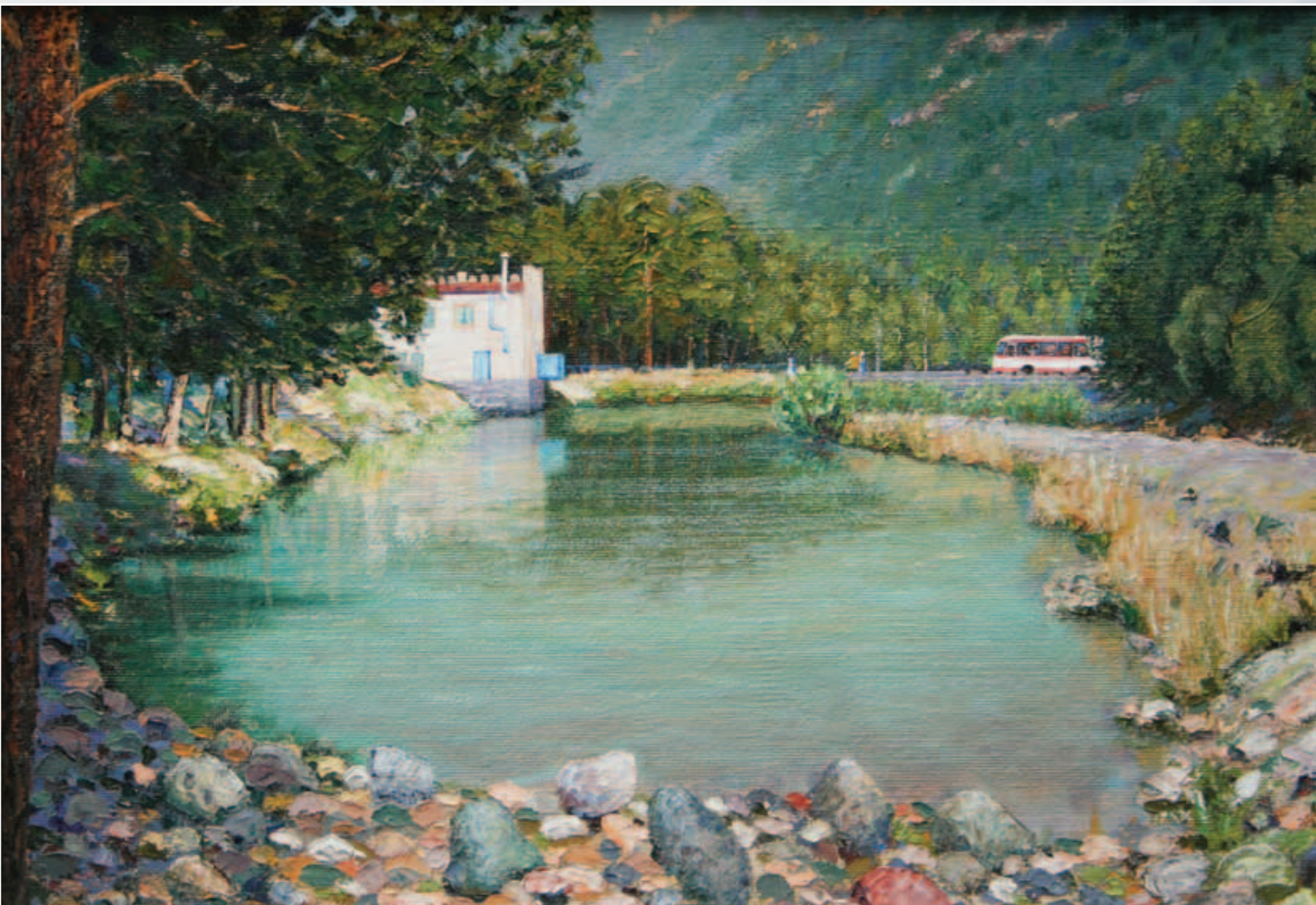
Приэльбрусье. Гостиница «Сокол». Картон, масло, 50x70