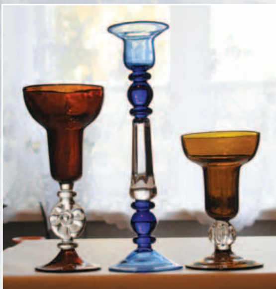
Подсвечники. Цветное стекло

Работы, выполненные в различные периоды творческой деятельности художника, были по достоинству оценены и экспонировались в Новосибирске, затем на выставке художников-любителей и народных умельцев в Москве, Республике Болгария, а также в различных городах Соединенных Штатов Америки.